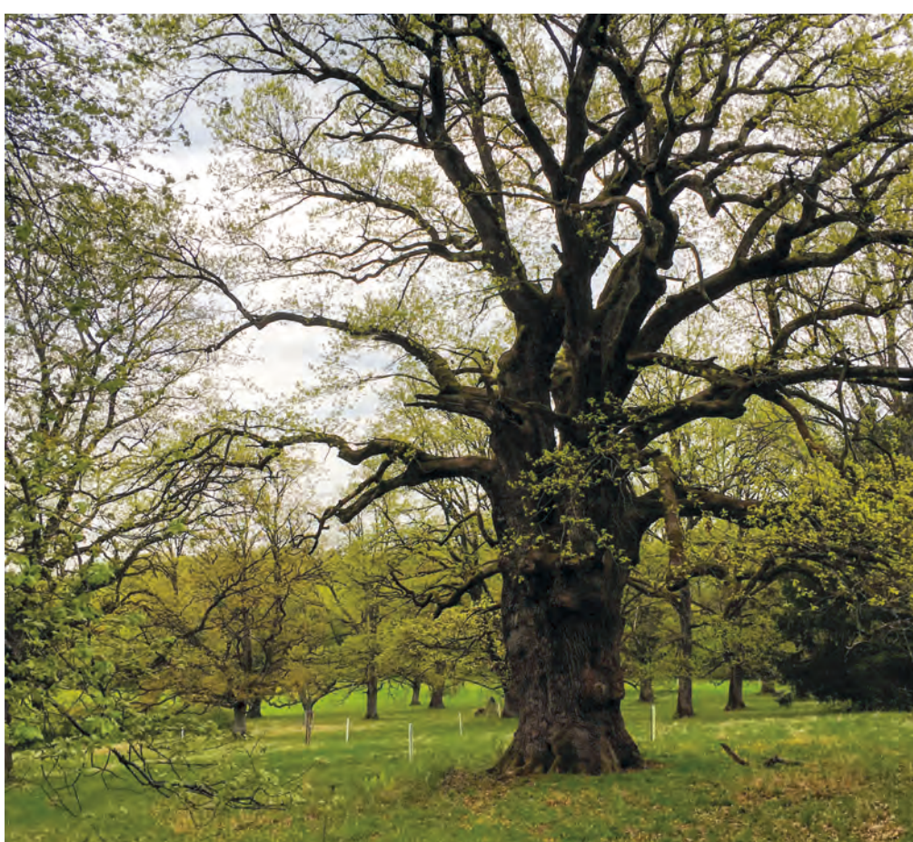
Un très vieux chêne comme celui-ci peut héberger jusqu'à un millier d'espèces d'insectes différentes.

Pour devenir vieux, les arbres ont besoin de conditions environnementales stables. Dans ce cas, un chêne peut atteindre les mille ans. Lorsqu'on l'entretient convenablement, un hêtre, par exemple, peut atteindre trois cent ans. En plus d'un entretien adéquat, il est également important de faire attention à la préservation des vieux arbres lors de travaux. Ce n'est que de cette manière qu'un jeune arbrisseau peut se développer en grand et vieil arbre biotope.