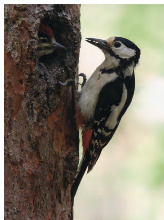
Les vieux arbres sont nécessaires à la présence du Pic épeiche, qui a besoin de cavités pour nicher.